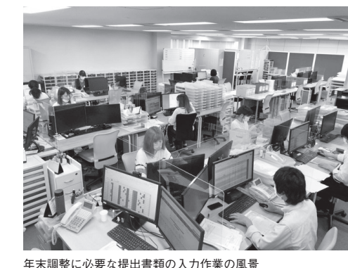
年末調整に必要な提出書類の入力作業の風景

いずれのケースにも親和性が高いサービスです。前者の場合は、毎年の人手不足や人員調達に頭を悩ませていたというケース、後者はアウトソースしてはいるもののサービス内容に対して不満があるケース、そのどちらのケースにもフィットするサービスとして好評いただいております。特に、後者の代行サービスでは、カバーしている代行業務の範囲が限定的なことが多いです。