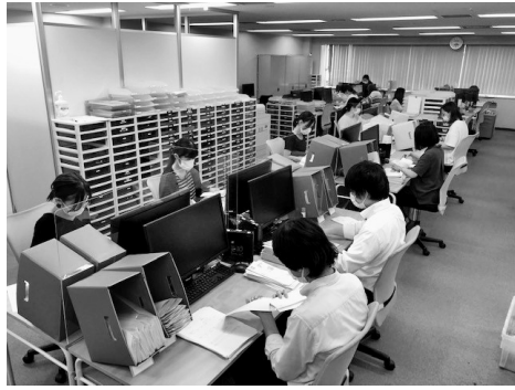
年末調整に必要な各種提出書類の封入・封緘作業の風景

ならではの導入メリットをご紹介します。お客様がご利用されている「人材ビジネス総合支援システムORDIA」の環境に弊社担当者が直接ログインすることで、さらにスピーディーな進行を実現します。作業する弊社担当者は年末調整の代行作業に必要な権限のみを設定して安全な環境下で入力作業を進めます。 また、外部から直接ログインできないセキュリティポリシーの高いユーザー企業には、弊社で入力用の作業環境を準備させて頂き、手間がかからない進行体制を編成します。いずれの場合も「人材ビジネス総合支援システムORDIA」